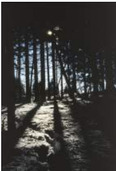
Na Črnem vrhu

Gremo navzgor po poti (trig. 1080 m) po pašnem svetu, ki se strmo spušča navzdol in mimo kozolca z napisom "dobrodošli na Čemšeniški planini" in še malo, pa smo pri planinskem domu dr. Franca Goloba na Čemšeniški planini (1120 m).