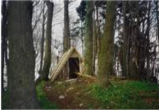
Bivak na Gozdniku