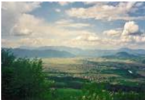
Savinjska dolina, Dobrovlje in Gora Oljka, v ozadju Raduha, Golte in Uršlja Gora

Razgled. Lovska koč Dobrovlje 14 a (828 m), LD Braslovče. Za orientacijo si poglejmo najbližjo Goro Oljko, k je na severovzhodu, za njo je Paški Kozjak (Špik, sv.Još, Basališče), Stenica, Konjiška gora (Stolpnik 1012 m, rs), v dolini desno je Andraž, zadaj Gradič v Šentilju. Na vzhodu je bližnji Vinski vrh (sv.Miklavž), zadaj sv. Jedrt, Gora (sv.Kunigunda). Pod nami Parižlje, Polzela, za njo Žalec, malo desno Šempeter (SIP, AERO), Grobeljski most, del nove avtoceste, Celje, nad njim stari grad, Grmada, Tovst. Na jugovzhodu je Hom (sv. Magdalena) s planinskim domom, Kamnik, Gozdnik, Golava, Mrzlica. Nad Migojnicami je Gradišče, Bukovica, Malič (as), V.Slomnik. Čez bližnjo Jugovo domačijo je na jugu sv. Lenart (kraj Vrhe), desno Kisovec, Gunova glava, Velika planina, preval Presedle in Kozica, levo je koničasti Javor s smučarsko vlečnico, zadaj Kum (as).