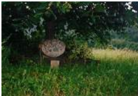
Zračnik nekdanjega rudnika v Zabukovici

bolj desno in smo že nad tovarno KIL Liboje. Ob nji gremo do ceste, levo po nji in smo spodaj med njo in večjo hišo. Nato gremo čez most nad potokom Bistro v križišče z asfc. Desno v Liboje in dalje na pod stene Kotečnika športno plezališče; levo na ap Liboje-KIL ali dalje za Petrovče.