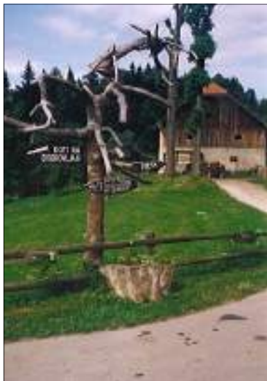
Smerokaz pri Domu na Dobrovljah

Od doma gremo le par korakov po asfc na zahod mimo Ramšakovega kozolca (lipa), domačije in soseda Rovtnika naprej po poti. Za Rovtnikovim kozolcem, predno se pričnemo spuščati po usekanem kolniku, je desno smučarska vlečnica, ki drži navzdol do Vrtačnika. Spuščamo se navzdol in prečimo gozdno cesto, ki drži na jug v Jame (s konca nje po slabem kolovozu se da priti do Strojanska). Dvignemo se po stezi in kolovozu mimo razpadajoče hmeljske sušilnice (pogled na sv. Urbana) mimo Kukovnika in kapele, kjer se počasi obračamo na jug. Skok skozi gozd na asfc, kjer se srečamo z nasadom duglazij. Smo v suhem podolju. Cesta vodi na jug rahlo v breg. Kmalu smo pri odcepu za Paragojnika (stavba desno nad nami), levo nad nami je Selišnik. Smo na razpotju in koncu asfc iz Letuša (10,3 km).