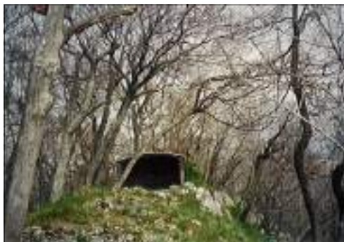
Bivak na Kamniku